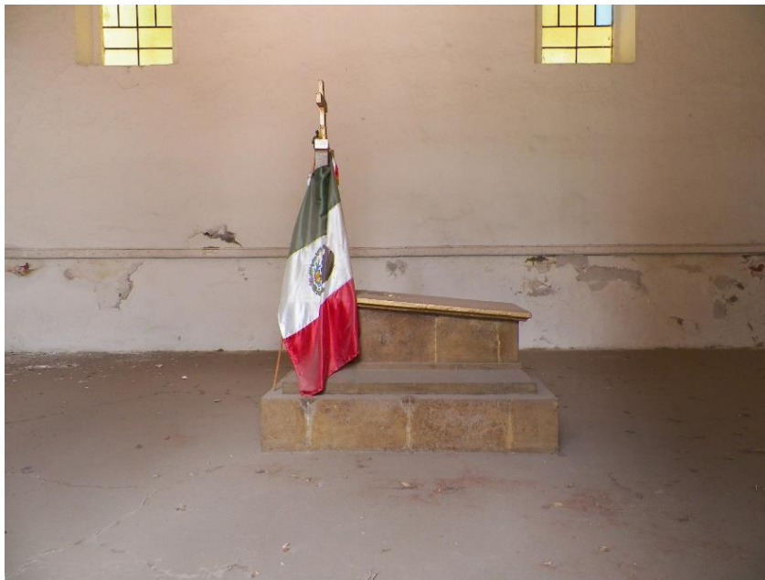
Foto 10. Estado actual de la Capilla Nacional de Morelos.