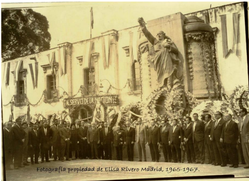
Foto 2. Acto cívico frente a la Casa de Morelos, 1965-1967.