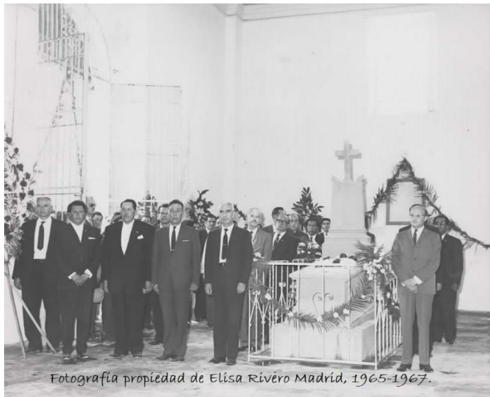
Foto 5. Guardia de honor junto a la tumba del Generalísimo Morelos 1965-1967.

manifestaciones, que hoy en día han decaído gracias a la ignorancia de algunos. Recuerdo, que años atrás se podían observar abundantes ofrendas florales, que se depositaban al pie de mi monumento. Las ceremonias se efectuaban con la mayor solemnidad, se pronunciaban discursos patrióticos, la concurrencia era numerosa; participaban políticos, militares, estudiantes, obreros y el pueblo en general (Foto 6).