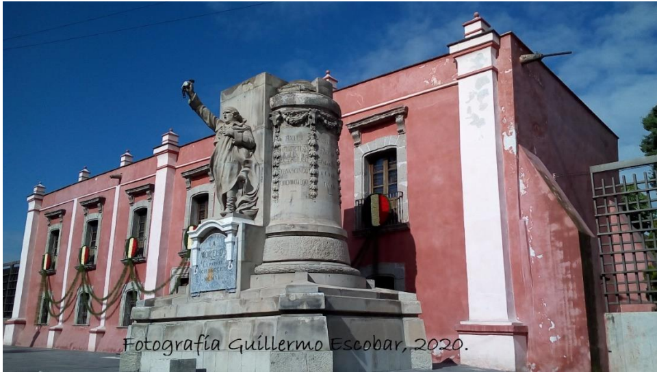
Foto 6. Casa de Morelos ubicada en el Barrio de San Juan Acalhuacan.

Sólo les recuerdo a todos aquellos que desconocen mi historia, que a las tres de la tarde un pelotón de fusilamiento, bajo las órdenes de Manuel de la Concha me quitó la vida. Precisamente en el sitio donde mi cuerpo cayó cuando las balas homicidas de los realistas truncaron mi vida, se levantó; este monumento que recuerda el sangriento suceso (Foto 7).