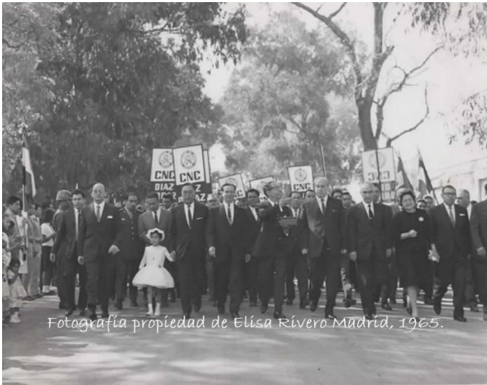
Fotografía propiedad de Elisa Rivero Madrid, 1965.

Foto 3. Desfiles encabezados por la clase política, militares, estudiantes, 1965 (Fotografía propiedad de Elisa Rivero Madrid).