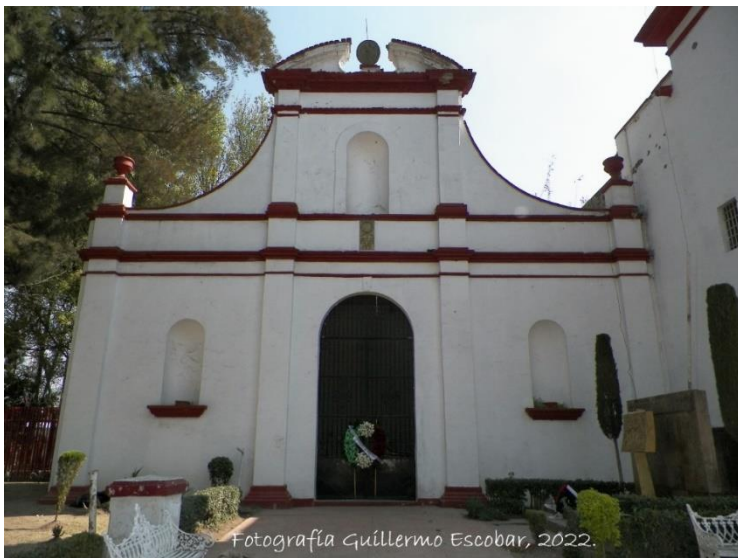
Foto 8. Capilla Nacional de Morelos.

El monumento edificado en el costado Norte del Templo de San Cristóbal es conocido popularmente como "Tumba de Morelos". La primera piedra de mi mausoleo se colocó el 22 de diciembre de 1902; y al siguiente año se inauguró mi tumba (Foto 8).