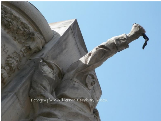
Foto 7. Monumento a Morelos de 1912.

Sólo les recuerdo a todos aquellos que desconocen mi historia, que a las tres de la tarde un pelotón de fusilamiento, bajo las órdenes de Manuel de la Concha me quitó la vida. Precisamente en el sitio donde mi cuerpo cayó cuando las balas homicidas de los realistas truncaron mi vida, se levantó; este monumento que recuerda el sangriento suceso (Foto 7).