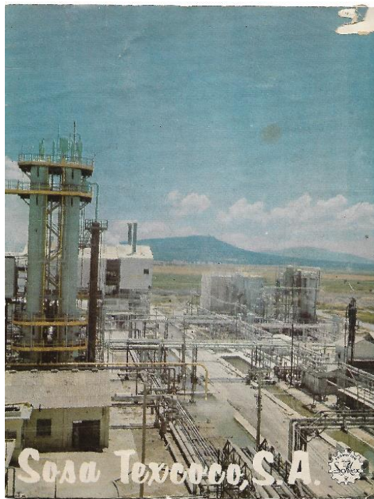
Foto 1. Torres de carbonatación.

El personal que laboraba en esta industria provenía en gran medida del Municipio de Ecatepec, principalmente de los pueblos cercanos como San Cristóbal Ecatepec, Santa María Chiconautla, Santo Tomás Chiconautla, San Isidro Atlautenco, Santa Clara Coatitla, San Pedro Xalostoc y Santa María Tulpetlac; así como de los Municipios de Tecámac, Acolman y Atenco.