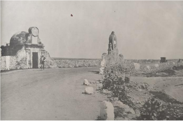
Foto 1. Capilla de San Juan Evangelista y frente a ella, retablo de la Virgen de Guadalupe en 1926. Vista Sur-Norte (Gante, 1935).

Veracruz, así como a los reales de minas de Pachuca.