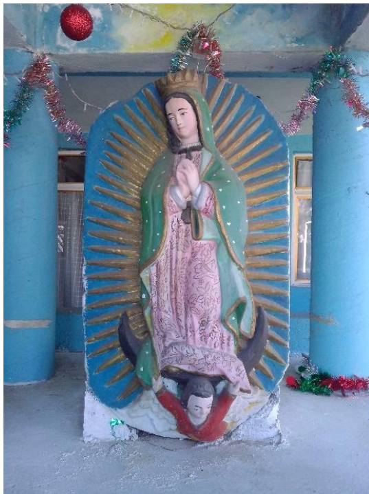
Foto 5. Escultura de la Virgen de Guadalupe ubicada originalmente en uno de los retablos del Albarradón de Ecatepec.