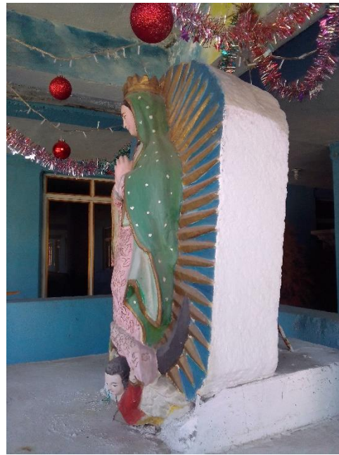
Foto 7. Perfil izquierdo de la escultura de la Virgen de Guadalupe (Fotografía Guillermo Escobar, 2022).