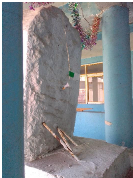
Foto 8. Parte posterior de la escultura de la Virgen de Guadalupe.