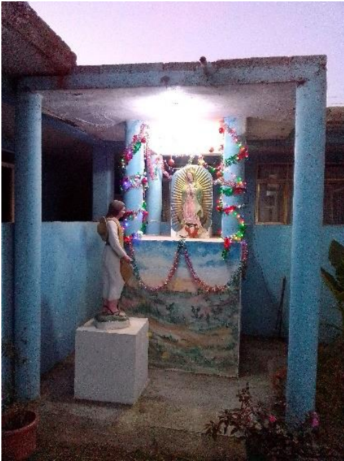
Foto 9. Virgen de Guadalupe ubicada actualmente en la Capilla de la Colonia Adolfo Ruiz Cortines.