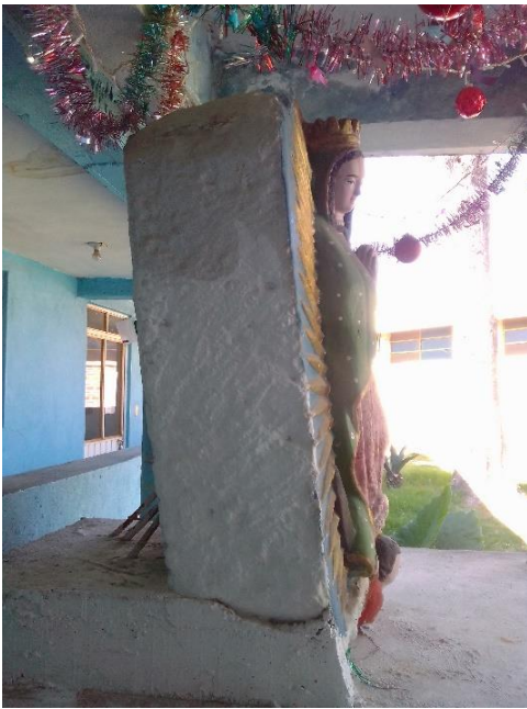
Foto 6. Perfil derecho de la escultura de la Virgen de Guadalupe.