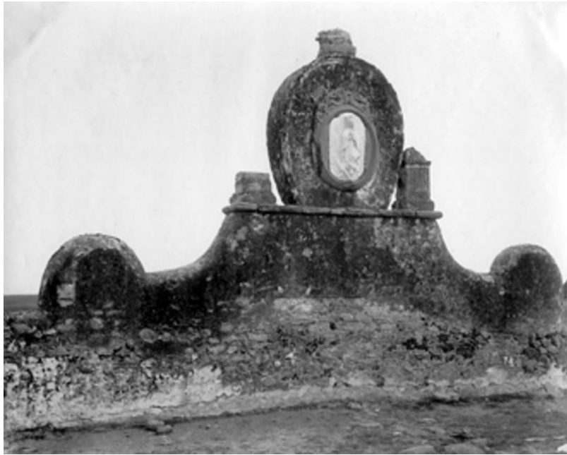
Foto 4. Retablo advocado a la Virgen de Guadalupe, ubicado frente a la Capilla de Cristo Rey.