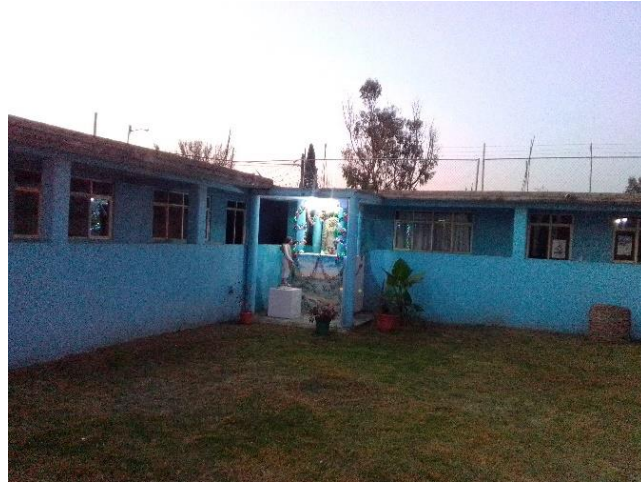
Foto 10. Escultura de la Virgen de Guadalupe que fue colocada en el jardín de la capilla.