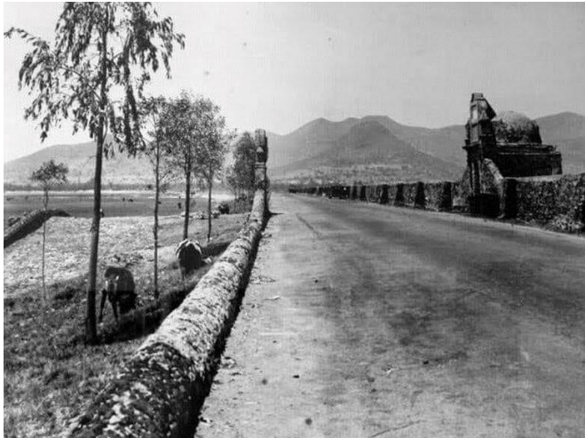
Foto 3. Vista Norte-Sur del Albarradón. A la derecha la Capilla de Cristo Rey y frente a ella el retrablo de piedra de la Virgen de Guadalupe en la década de los años 30 del Siglo XX (SINAFO-INAH).

de Guadalupe y del Refugio en la Colonia Adolfo Ruiz Cortines. 6 Con base en las características de la escultura y las fotografías antiguas consultadas, es probable que esa escultura haya sido la que estaba ubicada frente a la Capilla de Cristo Rey (Fotos 5 a 10).