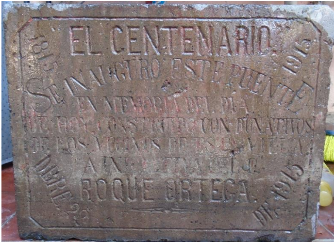
Foto 1. Lápida colocada en el "Puente Morelos" que atravesaba el antiguo camino inaugurado en 1915.

Antiguamente uno de los caminos principales para ingresar a San Cristóbal Ecatepec de Morelos se ubicaba en lo que en la actualidad es la Avenida Morelos. Los límites del camino en la primera década del Siglo XX eran al Oriente hasta la actual calle Mariano Matamoros y al Poniente hasta el Rancho de Jauregui.