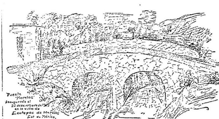
Figura 1. Puente Morelos, inaugurado el 22 de diciembre de 1915 (Imagen tomada de El Pueblo, “Inauguración del Puente Morelos”, 24 de diciembre de 1915, año II, tomo II, núm, 422, p.5).

La antigua Villa de San Cristóbal Ecatepec, era atravesada por varias barrancas que procedían de la Sierra de Guadalupe, las aguas eran cristalinas, pero ocasionaban estragos a sus pobladores durante la época de lluvias, por ello en la localidad se construyeron cinco pequeños puentes, que ayudaban a sus pobladores; y así evitar ser arrastrados por la corriente de agua. Uno de esos puentes fue colocado al Oriente del poblado, sobre el camino principal, que cruzada San Cristóbal. 1 La barranca se ubicaba en lo que actualmente es calle “La Barranca” (Figura 1).