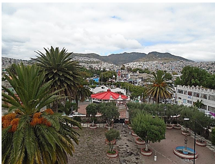
Foto 1. Panorámica del Pueblo de Santa María Tulpetlac.

E n este boletín se menciona el patriótico acto de apoyo que brindaron al Gobierno del Presidente Benito Juárez García los ciudadanos del Pueblo de Santa María Tulpetlac durante la segunda intervención francesa a México en el año de 1862 (Foto 1).