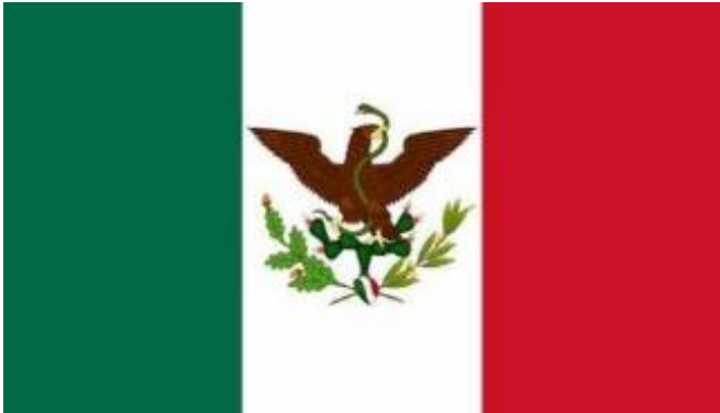
Figura 1. Bandera Mexicana durante el periodo presidencial del Lic. Benito Juárez García.

considerado el más importante del orbe. El Ejército de Oriente estuvo apoyado por los naturales de Zacapoaxtla, Xochiapulco y Tetela 1 (Figura 1).