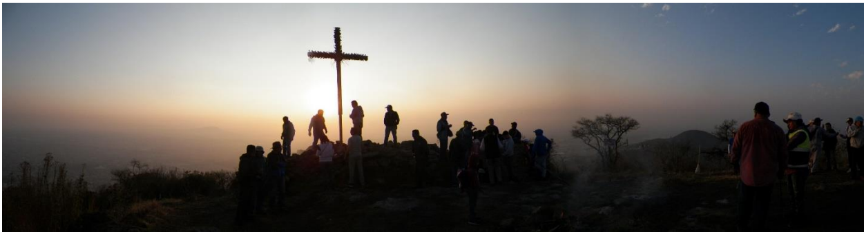
Foto 6. La Santa Cruz es bajada del Ehecatepetl el segundo sábado del mes de abril.

la Familia Ríos prepara el sotol que adornará la cruz, las hojas se limpian quitando las espinas, se tejen los cendales 18 y flores. 19 El día primero de mayo por la mañana se decora la Cruz y en la decoración de la misma participan además de la Familia Ríos, personas de la comunidad, que voluntariamente apoyan durante los trabajos. Ya vestida o decorada la Cruz, a las 12:00 horas es trasladada al Templo de San Cristóbal y es colocada en el presbiterio. 20 Ahí permanece hasta el día 03 de mayo (Foto 6).