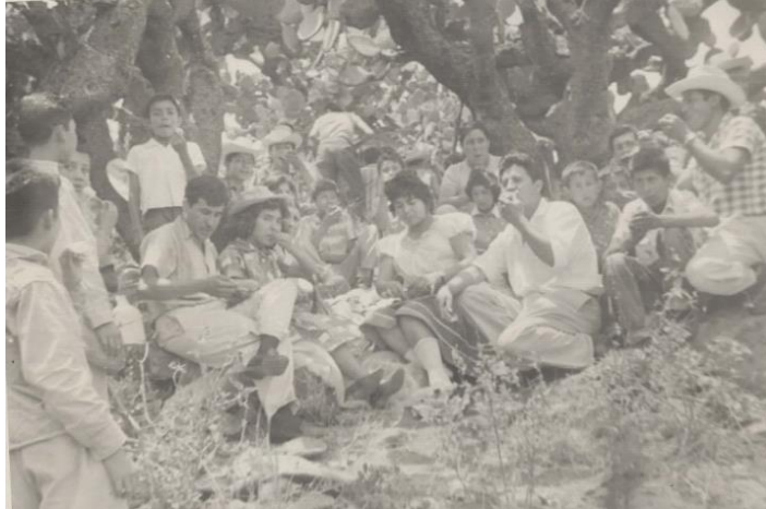
Foto 9. Cada familia tenía su espacio donde comían, normalmente era definido por una nopalera; 1963.