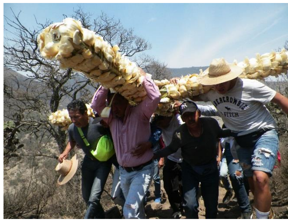
Foto 14. La Santa Cruz arribando a la cima del Ehecatepetl.