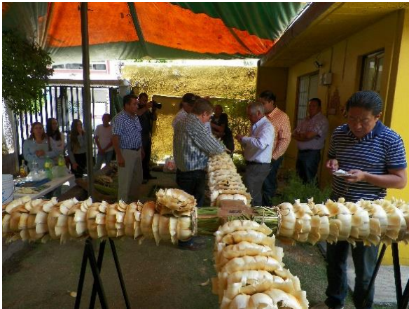
Foto 13. Decoración de la Cruz.