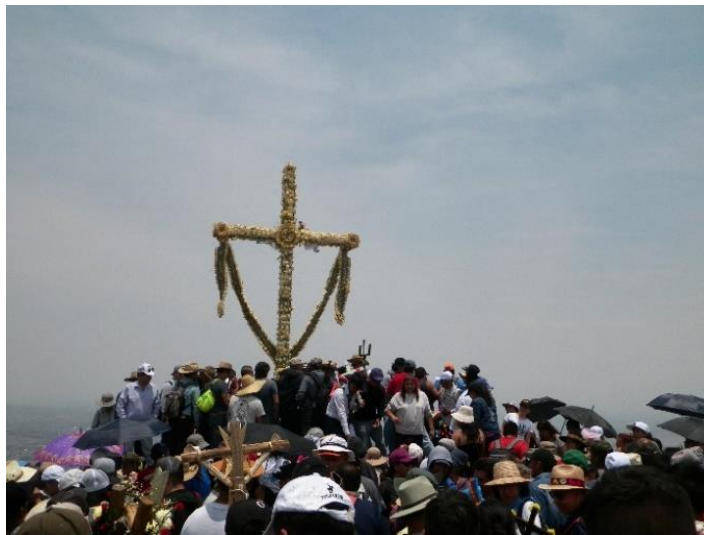
Foto 17. Santa Cruz colocada en la cima del Ehecatepetl.

La Fiesta de la Santa Cruz demuestra la sobrevivencia hasta la actualidad de este importante nexo entre los ritos de la siembra, la lluvia y los cerros. En lo alto del cerro abrasado por la sequía de la estación, se sigue invocando la llegada de las lluvias fertilizadoras. La cruz cristiana reúne en sí el simbolismo prehispánico de las deidades del maíz, de la tierra y las lluvias. En esta actividad ritual, se superponen elementos del cristianismo, con otros de carácter indígena mesoamericano y anteriormente lo económico, con lo social.