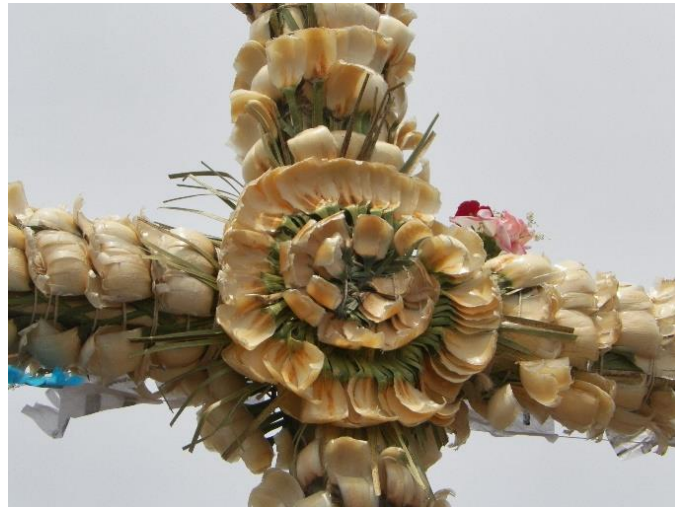
Foto 18. Detalle de la Santa Cruz.

Esta es una de las celebraciones más importantes que fusiona el culto prehispánico agrícola con la liturgia católica. Esta fecha marca el final de la temporada seca y el inicio de la estación de lluvias, por ello; en la cima de los cerros se levantan cruces.