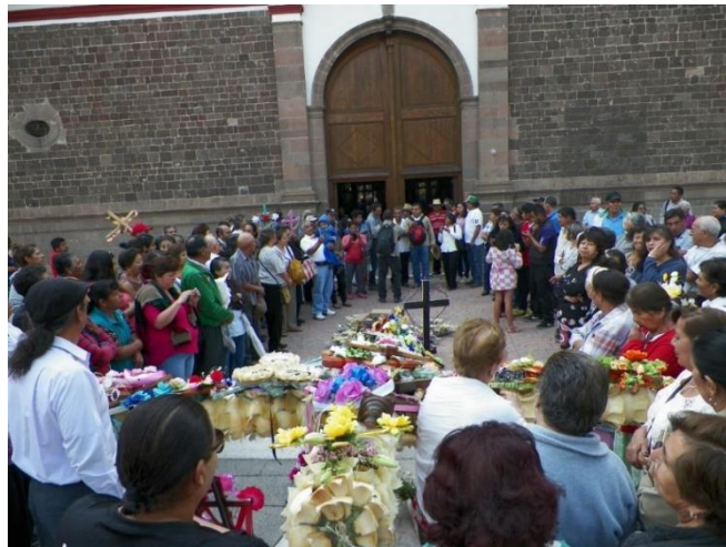
Foto 7. Bendición de las cruces por parte de un sacerdote en el atrio del Templo de San Cristóbal.

La Santa Cruz es recibida en la Capilla del Calvario ubicada 1 km al Poniente del Templo de San Cristóbal y después continúa su trayecto por la Colonia Tierra Blanca. Ya en la ladera Poniente del “Ehecatepetl” se realiza una parada en el lugar denominado “El descanso”, paraje donde los hombres que cargan la cruz se refrescan para continuar su camino. El camino es sinuoso, estrecho y largo. El contingente es acompañado por feligreses, una banda de viento; en ocasiones por algunos elementos de la Policía Montada y durante el camino se queman cohetones. Durante el trayecto se van haciendo relevos cada vez que se cansan los portadores de la cruz.