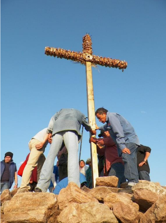
Foto 5. Tradicionalmente la cruz es bajada el segundo sábado del mes de abril por un grupo de hombres de la comunidad.

Como símbolo dominante la “Santa Cruz” es el objeto ritual que focaliza la atención de los participantes. El simbolismo de la cruz combinó el culto católico con el de las deidades naturales (Agua, viento, espíritus de la montaña). Se le pedía fertilidad, salud y riqueza entre otros.