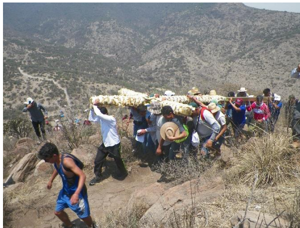
Foto 16. Subida al Ehecatepetl.