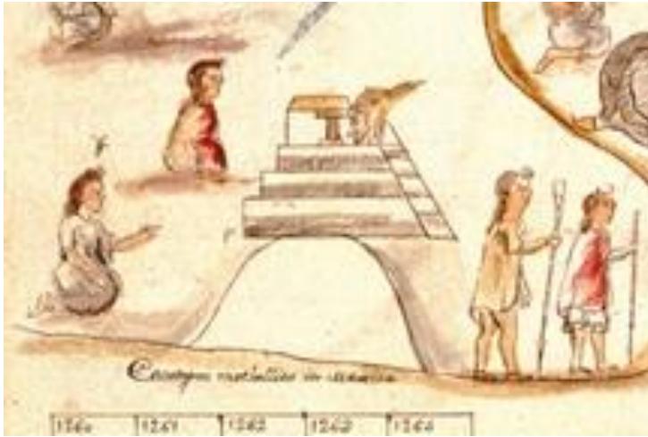
Foto 3. Cerro (Ehecatpetl), que en su cúspide está coronado con un templo, representado de perfil, en cuyo interior se encuentra una ave (Fragmento de la Lámina 16 del Códice Azcatitlan).

El asentamiento Posclásico fue registrado en los siguientes Códices: Vaticano, Aubin, Telleriano Remensis, Matrícula de Tributos, Tira de la Peregrinación, Mendoza, Azcatitlan, Xólotl e Historia de los Mexicanos.