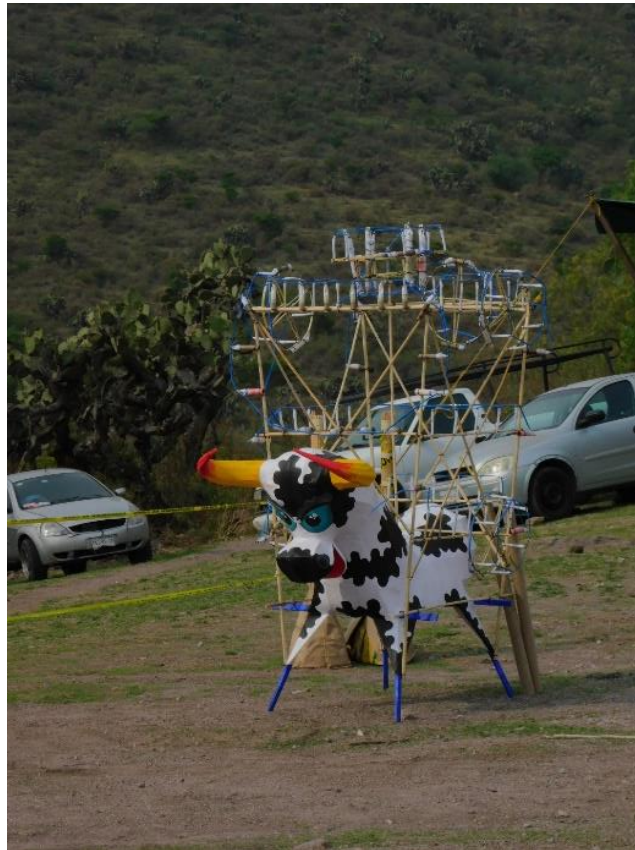
Foto 10. Toritos en el paraje denominado "El Puerto".

Para su decoración se utilizan de siete a ocho piñas grandes de sotol, que se emplean para vestir la cruz y de seis a ocho piñas de sotol chicas