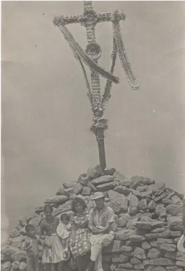
Foto 11. Originalmente la cruz era de madera de forma cilíndrica. Mayo de 1963.