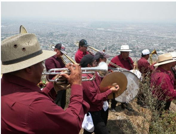
Foto 15. La banda de música.