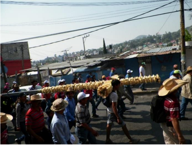
Foto 8. Grupo de hombres de la comunidad con profunda devoción y emoción cargan la cruz en hombros (Fotografía Guillermo Escobar, 2018).

Cabe resaltar, que en la cima del cerro, se ubica un altar pequeño donde se realiza la celebración eucarística al llegar la cruz. Al concluir la celebración religiosa y después de bendecir las cruces que portan los feligreses, llega el momento más esperado por los fieles; y la cruz es colocada sobre un montículo de piedras, mientras se lanzan cohetes al aire y la banda de viento toca alegres melodías.