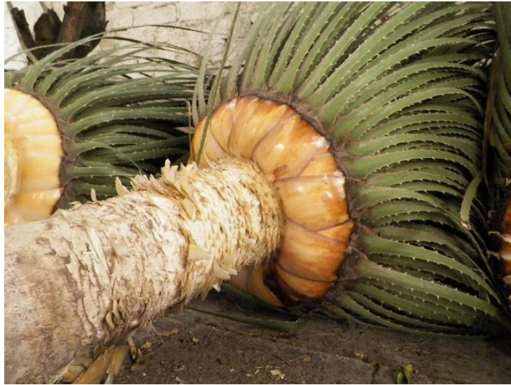
Foto 12. Soto utilizado para la decoración de la Santa Cruz.

Cabe aclarar que aunque no se utiliza el término “Mayordomo”, existe un gran número de personas que conforman una “Comisión” y cubren los gastos de la fiesta.