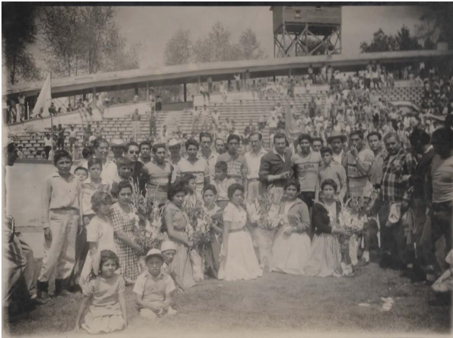
Foto 8. Llegada de los triunfadores al Parque Calles.