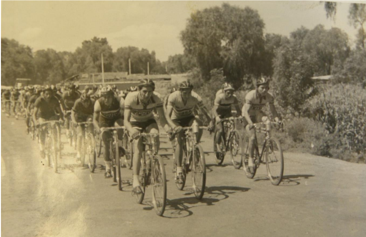
Foto 2. Equipo de ciclismo "Sosa Texcoco".

Estación del Ferrocarril de Cintura y la meta en el Velódromo Parque Calles (Foto 2).