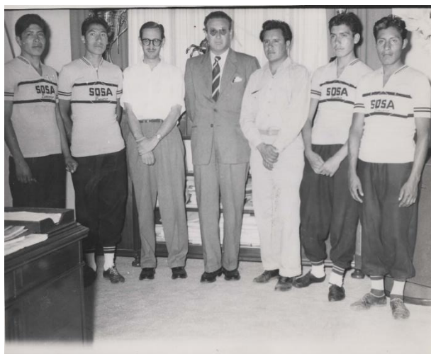
Foto 1. Equipo de ciclismo “Sosa Texcoco” con directivos de la Empresa Sosa Texcoco.

La V Vuelta Ciclista “Himno Nacional” fue organizada por el Instituto Nacional de la Juventud Mexicana y se desarrolló del 05 al 14 de septiembre del año 1958, el recorrido total de la carrera fue de 1170 Km, estuvo dividida en diez etapas, así como etapas intermedias. La salida fue en la