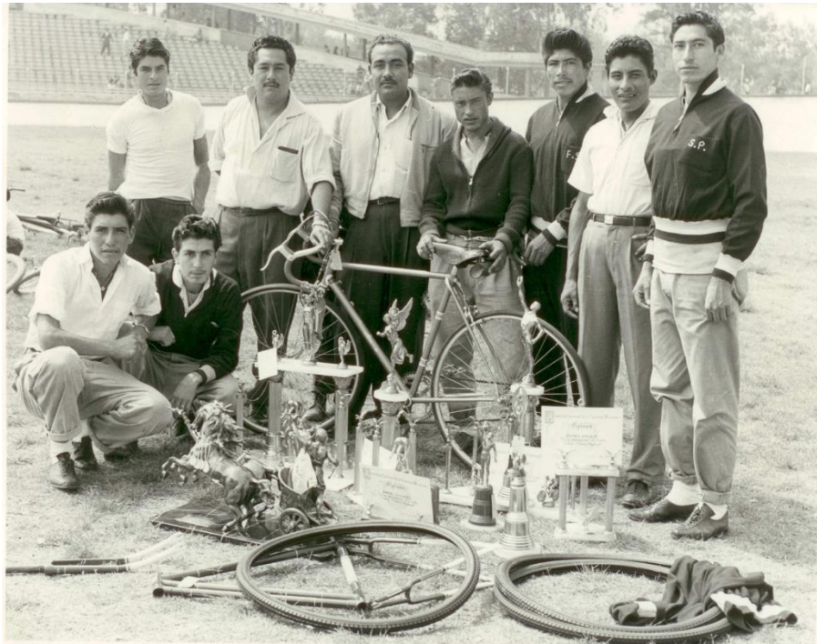
Foto 9. Trofeos obtenidos por el Equipo de Ciclismo "Sosa Texcoco".