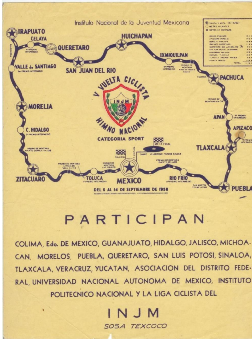
Foto 3. Etapas de la V Vuelta Ciclista "Himno Nacional".