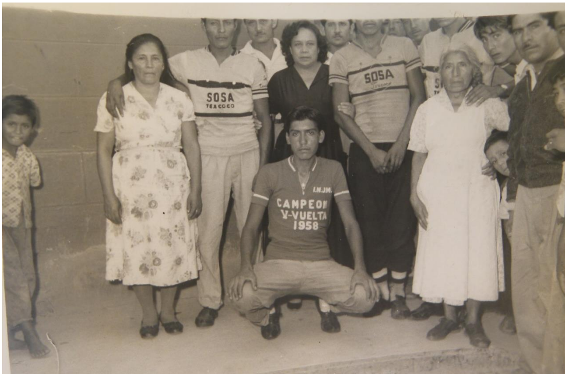
Foto 7. Los triunfadores con sus familiares y amigos.