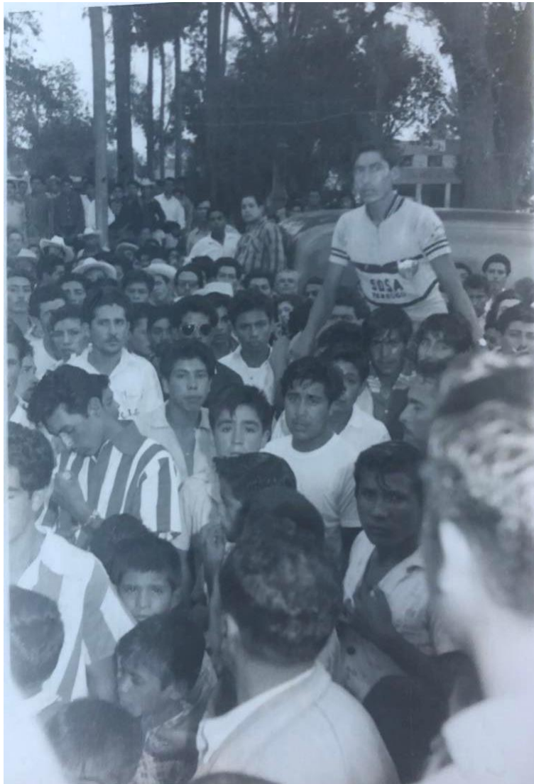
Foto 6. Cálida bienvenida a los integrantes de la cuarteta de ciclismo en San Cristóbal Ecatepec de Morelos.

Al obtener este triunfo la cuarteta de ciclismo “Sosa Texcoco”, fueron recibidos con gran algarabía en San Cristóbal Ecatepec. El Equipo de Futbol Morelos encabezó el recibimiento con mariachis y cohetones. Los esperaron en lo que hoy es la Vía Morelos y los trajeron en hombros hasta el centro de San Cristóbal (Fotos 5, 6 y 7).