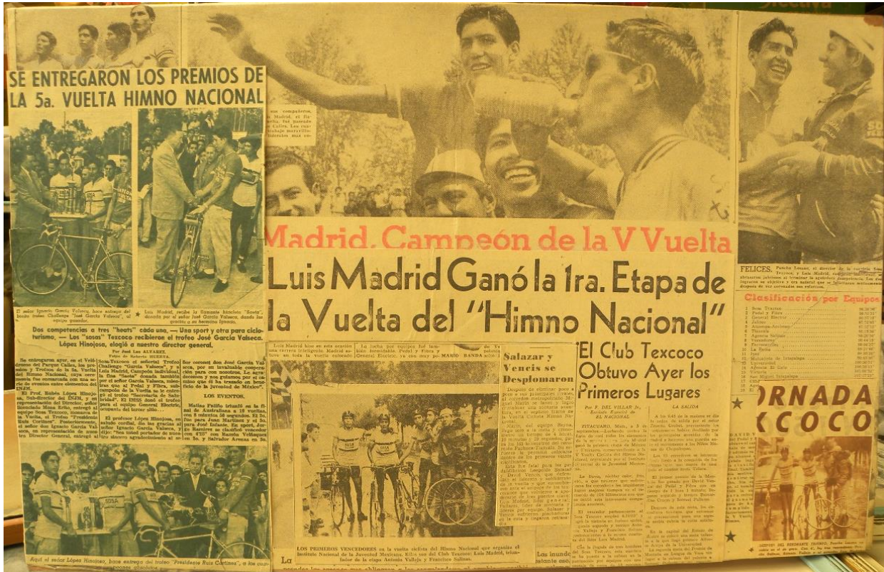
Foto 10. Notas periodísticas del memorable triunfo del Equipo de Ciclismo "Sosa Texcoco".