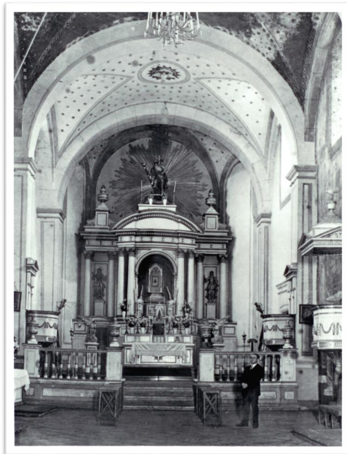
Foto 1. Interior del Templo de San Cristóbal.

El 28 de julio del año 1957 a las 02:40 horas ocurrió un sismo de magnitud 7.8 grados Richter, que generó considerables daños en la estructura arquitectónica del