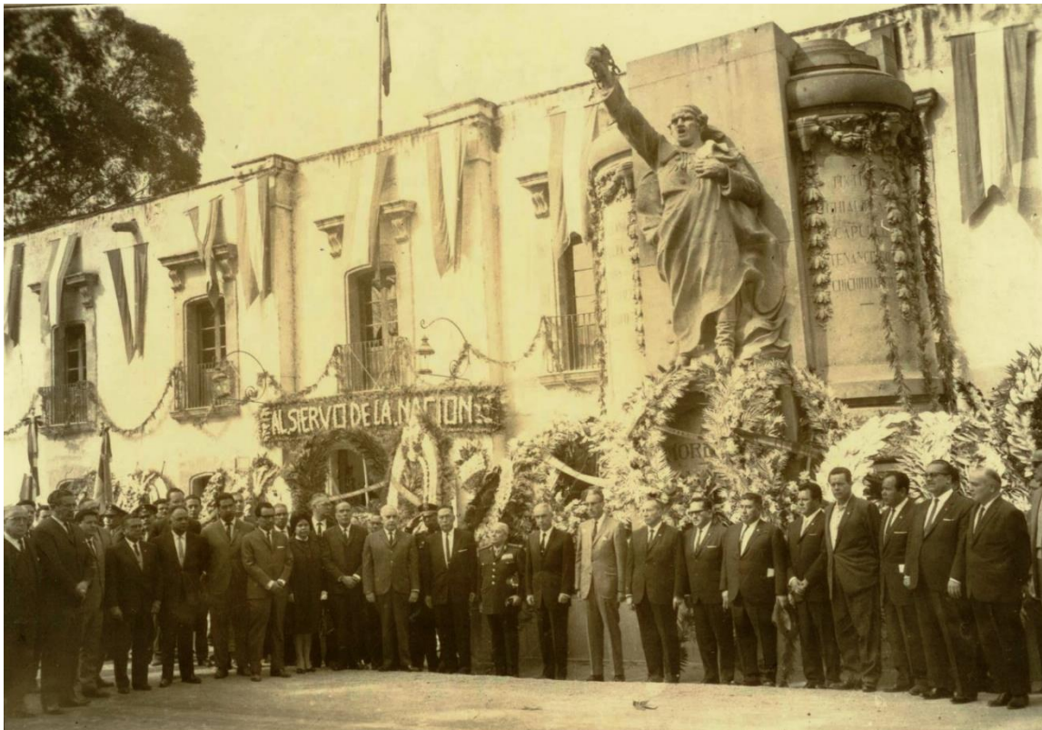
Foto 2. Guardia de honor después del acto cívico frente al Monumento a Morelos en el año de 1965 (Fotografía propiedad de Elisa Rivero Madrid).

largo de la historia, eran muy significativos y solemnes. Al finalizar el acto cívico se realizaba lo que los abuelos nombraban “Comilonas” 1 o “Comelitones” 2 ; por ello el objetivo de este texto es presentar algunos de los menús que se sirvieron al concluir los actos cívicos en honor al generalísimo, mostrando algunos platillos típicos de la localidad (Foto 2).