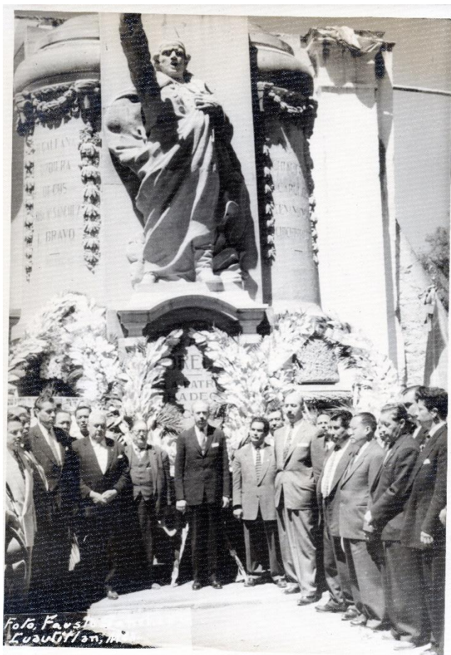
Foto 1. Guardia de honor frente al Monumento a Morelos 1955-1957.

Las manifestaciones patrióticas o actos cívicos verificados en San Cristóbal Ecatepec de Morelos a lo