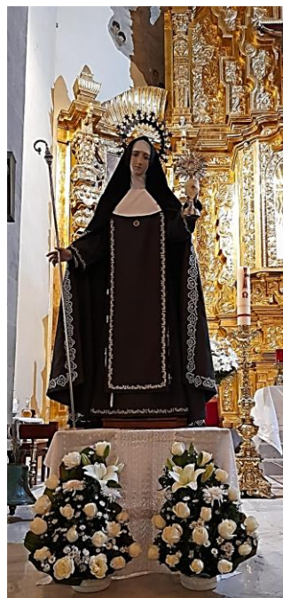
Foto 4. Escultura de la Santa Patrona de Coatitla.