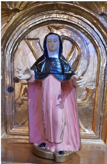
Foto 3. Escultura de Santa Clara ubicada en el cancel de la entrada al templo.

Dos pedazos de tierras eran de magueyales ( Tepetlac y Atlicoliucan ), cuatro eran parajes sin sembrar o limpios ( Tepetlac , Yztlahuatlena , Tecanaco y Tlateltitlan y en dos parajes no menciona para qué eran utilizados ( Tepexicasco y Sanjaco ).