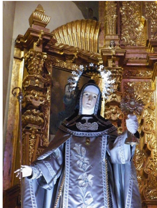
Foto 1. Santa Clara de Asís, Virgen.

En el documento histórico se mencionan ocho tierras distribuidas