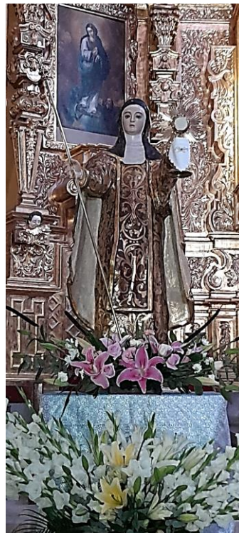
Foto 2. Escultura estofada de Santa Clara de Asís.

El tercer pedazo se ubicaba en el paraje nombrado Yztlahuatlena , era un paraje sin sembrar que medía de largo 53 varas y de ancho 53 varas. Al Norte colindaba con tierras de Comunidad, por el Sur y Poniente con tierras de San Pedro Xalostoc y al Oriente con tierras de ciudadanos del Pueblo de Santa Clara (Foto 2).