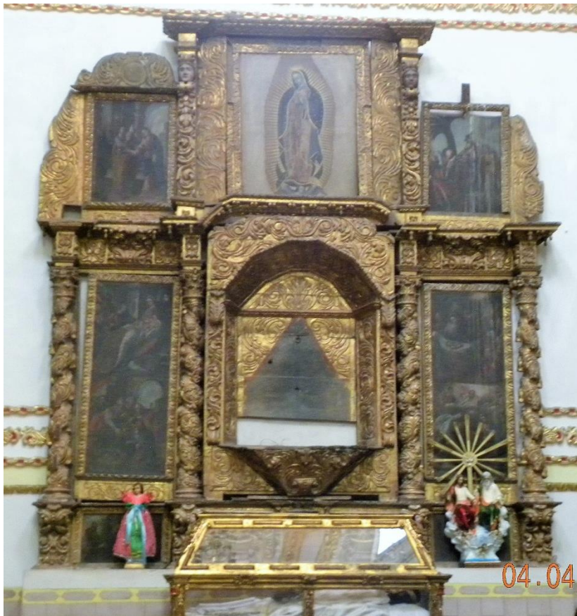
Foto 4. Retablo colateral del Siglo XVIII.

Se menciona el nombre de quien tenía a su cargo la custodia del templo y de todos sus bienes y se llamaba Antonio de Guadalupe. Aunque no se menciona en el documento, es probable que se trate del fiscal.