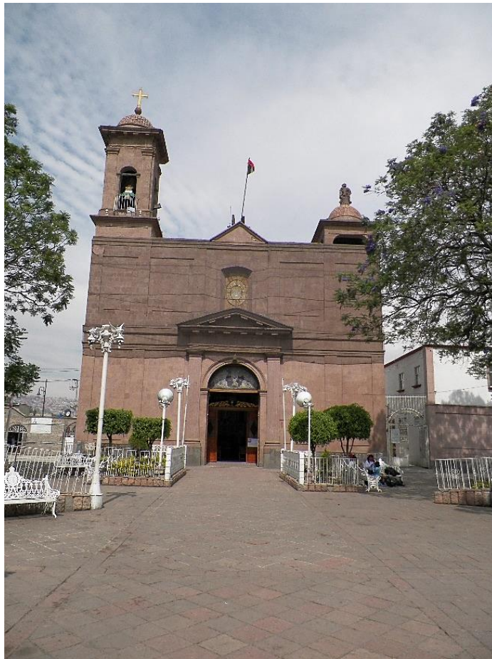
Foto 1. Templo de San Pedro Apóstol.

En el año de 1792 se realizó el inventario del Templo de San Pedro Apóstol, en el Pueblo de San Pedro Xalostoc, el cual se localiza en uno de los apartados del libro intitulado “INVENTARIOS de los bienes de la Cabeza, y Pueblos de esta Parr a de S. CHRISTOVAL, y assimismo de los Papeles existentes, y q e en adelante huviere en el Archivo. Año de 1763.” (Fotos 1 y 2).