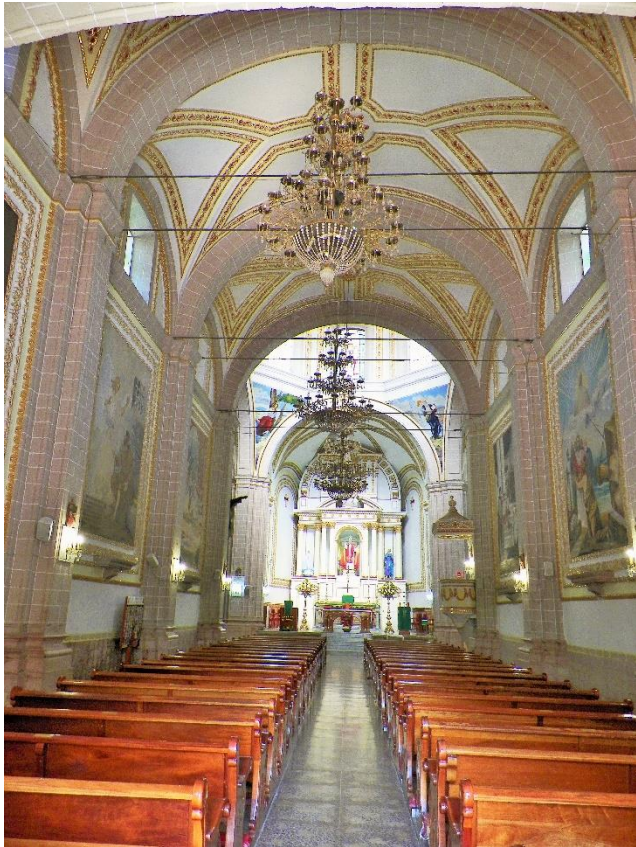
Foto 2. Interior del Templo de San Pedro Apóstol.

El inventario y la sección que corresponde al Templo de San Pedro Apóstol se intitula Ynventario de los bienes de la Yglesia de Sr. Pedro Xaloztoc , que está conformado por cinco fojas, escritas en algunos casos en anverso y reverso, divididas en: Altares, Plata y Ropa de Sacristía 1 .