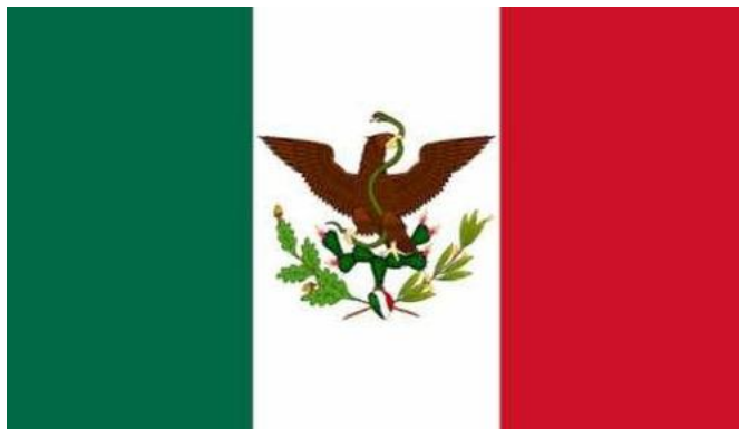
Figura 1. Bandera Mexicana durante el periodo presidencial del Lic. Benito Juárez García.