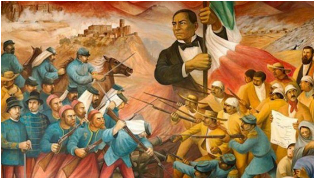
Figura 2. Mural ubicado en el Museo Nacional de Historia intitulado "Juárez símbolo de la República contra la Intervención Francesa" de Antonio González Orozco, 1972.

El gobierno mexicano encabezado por el Lic. Benito Juárez García, anunció la suspensión de los pagos de la deuda externa en el año de 1861. A raíz de ello, el 31 de octubre del año 1861 en Londres, Francia, Reino Unido y España, como respuesta formaron una alianza y suscribieron un convenio para enviar a las costas mexicanas tropas, con objeto de cobrar deudas acumuladas. Las tropas de la alianza desembarcaron en territorio mexicano en enero del año 1862. Las misiones española y británica decidieron volver, sin embargo; los franceses anunciaron que ocuparían México (Figura 2).