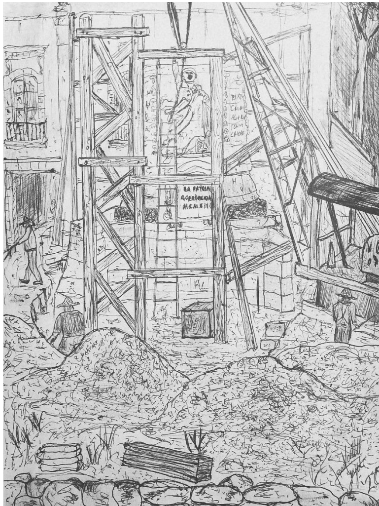
Figura 2. Recreación del proceso de colocación del Monumento a Morelos (Ilustración Hector Valtierra Leyva, 2020).

Finalmente, el 22 de diciembre del año 1912 había sido debidamente concluido e inaugurado el Monumento a Morelos. También, se realizó una ceremonia conmemorativa en lo que hoy es la Capilla Nacional de Morelos en