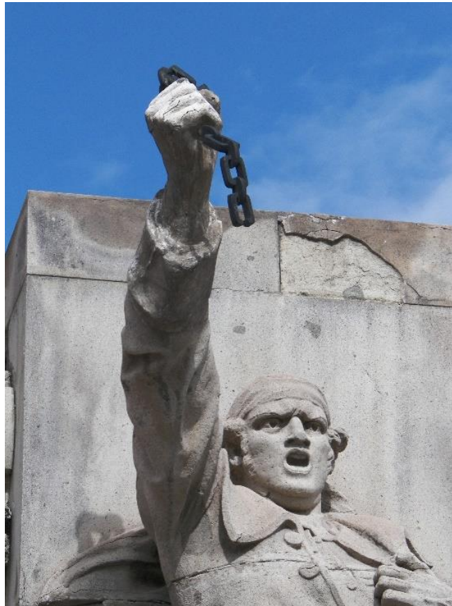
Foto 3. El Generalísimo José María Morelos y Pavón con su característico atuendo.

Para el 10 de diciembre del año 1912, ya estaban los preparativos para celebrar con gran solemnidad el aniversario de la muerte de Morelos. Infinidad de clubes y corporaciones estaban redactando programas, confeccionando nuevos estandartes y todo lo necesario para celebrar el día 22 con grandes fiestas en San Cristóbal Ecatepec, ante el monumento allí erigido a su memoria. La Asociación del Colegio Militar preparaba una función para ese día. La Secretaría de Guerra, ordenó que una brigada compuesta por las tres armas, fuera a San Cristóbal Ecatepec, a hacer los honores de ordenanza a Morelos (Foto 3). Se notificó, que el monumento se inauguraría el día 22 de diciembre