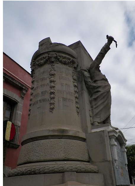
Foto 7. Costado Sur del monumento.