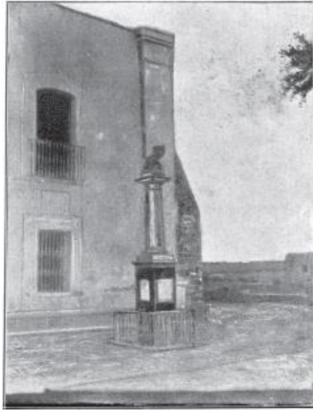
Figura 1. Monumento a Morelos colocado en 1900 frente a la Casa de los Virreyes (Galindo y Villa, 1900 Lámina 55, Fig. 1ª).

acompañantes para recorrer la casa 15 . El monumento que se menciona, no se trataba del monumento diseñado y elaborado por el Arquitecto Ramón López de Lara, esto con base en la información de dos notas periodísticas del 29 de marzo del año 1912 en las que se describe un monumento (Figura 1).