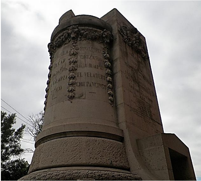
Foto 6. Costado Norte del monumento.

Veladero, Chilpancingo (Foto 6) . Del lado Sur del monumento se lee de izquierda a derecha se lee: Guerrero, Bravo, Trujano, Liceaga, Juan Álvarez; Matamoros, Victoria, Mier y Terán, Manuela Medina (La Capitana), Narciso Mendoza; H. Galeana, Ordiera, Dr. Cos, José Ma. Sánchez, L. Bravo (Foto 7).