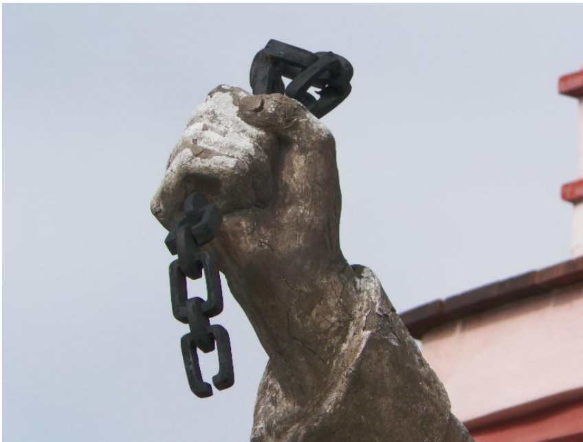
Foto 5. El monumento se ubica en el sitio del fusilamiento, se destaca al HÉROE mostrando triunfante las cadenas rotas.

El monumento está manufacturado en cantera, mármol y hierro. La fachada principal del monumento se encuentra mirando al Oriente y se destaca la figura de Morelos con su característico atuendo con un paliacate atado en la cabeza. El monumento se ubica precisamente en el sitio del fusilamiento, se destaca al HÉROE mostrando triunfante las cadenas rotas (Foto 5). Lo flanquean dos columnas con inscripciones en ambos costados con los nombres de algunos HÉROES; y los sitios recorridos durante cuatro campañas militares, todo delimitado por guirnaldas de laurel 27 .