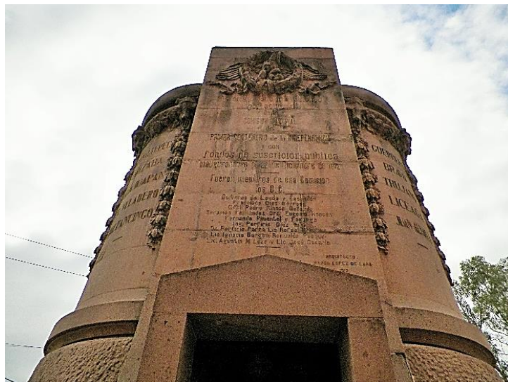
Foto 8. Costado Poniente del monumento.