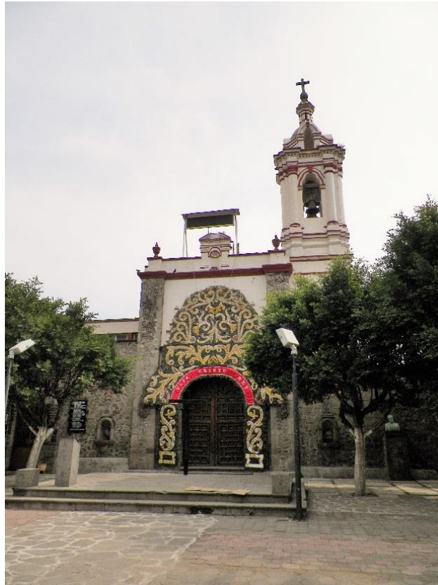
Foto 1. Originalmente el Templo del Pueblo de Tulpetlac estuvo advocado a la Virgen de la Purísima Concepción.