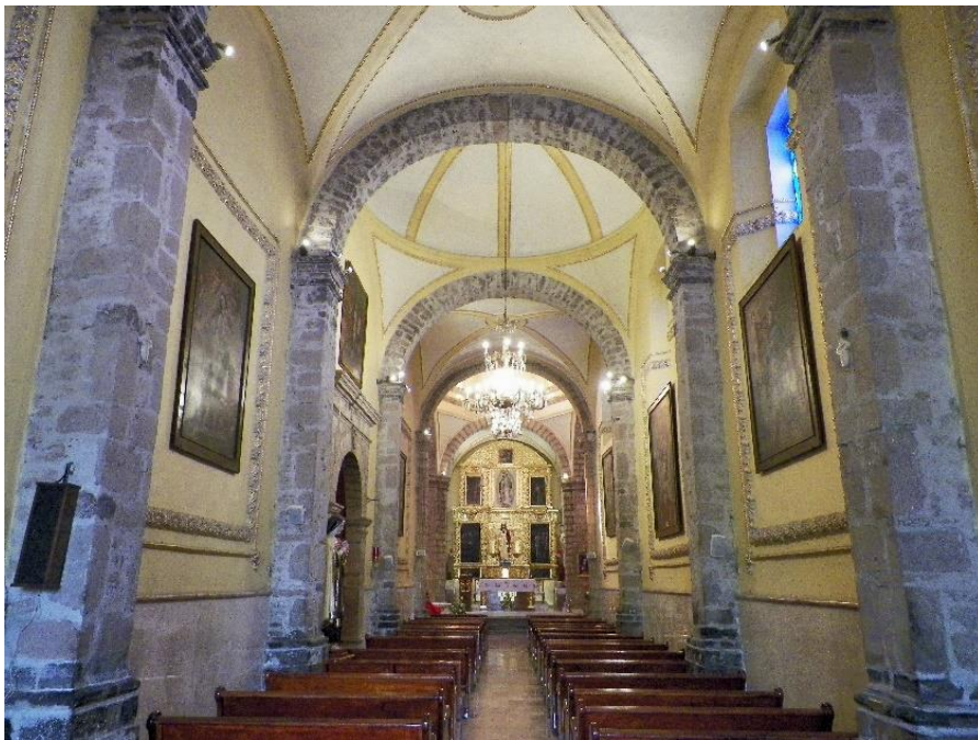
Foto 2. Interior del templo advocado originalmente a la Virgen de la Purísima Concepción.

Las tierras de labor y magueyales que se enlistaron en noviembre de 1785, pertenecían a Santa María de la Concepción, al Santo Cristo de la Capilla, al Espíritu Santo, al Nacimiento de Nuestro Señor, a la Resurrección del Señor y a los Santos Reyes (Foto 2).