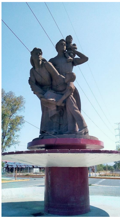
Foto 3. Conjunto escultórico intitolado “La Familia tesoro invaluable”, obra del escultor Víctor Gutiérrez.

Ubicación: Colonia Jardines de Morelos (Av. Jardines de Morelos 9 ).