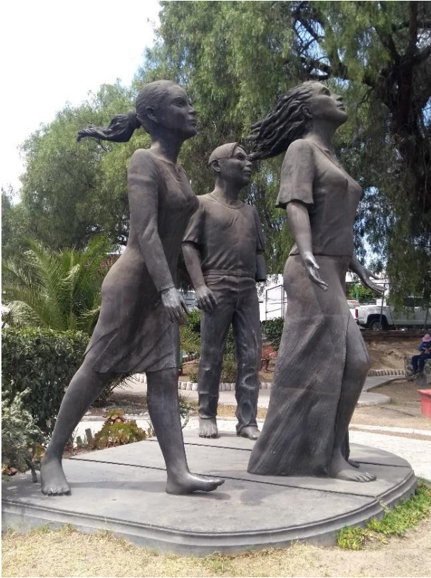
Foto 2. Conjunto escultórico intitulado "Viento al nuevo milenio", obra del escultor Pedro Ramírez Ponzanelli.

Categoría: Conjunto escultórico antropomorfo (Escena, cuerpo completo, Foto 2).