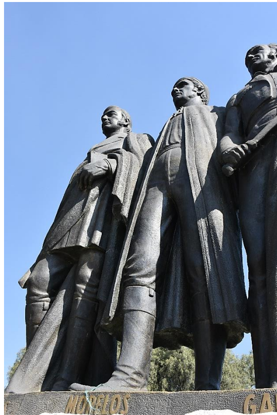
Foto 1. Conjunto escultórico intitulado "La Trilogía", obra del escultor Ernesto E. Tamariz.

Es de vital importancia implementar estrategias para la protección, conservación y difusión de los bienes artísticos, que se encuentran en nuestro Municipio. Este inventario tiene el propósito de facilitar la toma de decisiones que fortalezcan las buenas prácticas de cuidado y protección de las Obras de Arte tangibles con las que cuenta el Municipio (Foto 1).